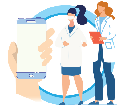
В СЛУЧАЕ ЗАБОЛЕВАНИЯ ОБРАЩАЙТЕСЬ К ВРАЧУ