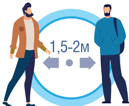
СОБЛЮДАЙТЕ РАССТОЯНИЕ И ЭТИКЕТ