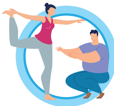
ВЕДИТЕ ЗДОРОВЬИЙ ОБРАЗ ЖИЗНИ